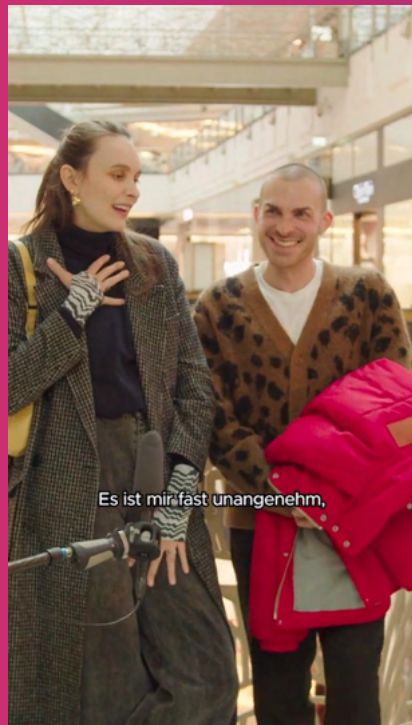
Content für Instagram & Facebook "Frauengesundheit" Client: KKH Agency: ressourcenmangel