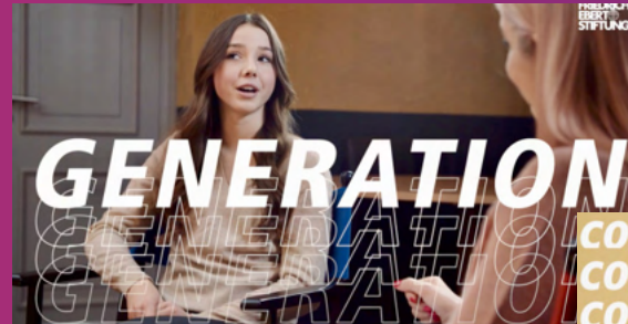
Reportage "Jung, jüdisch, engagiert"

Politische Bildung - machen wir anders. Mit Influencer:innen aus Social Media UND Politik.