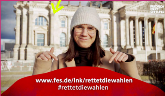
Demokratiekampagne "Jung & wählbar"