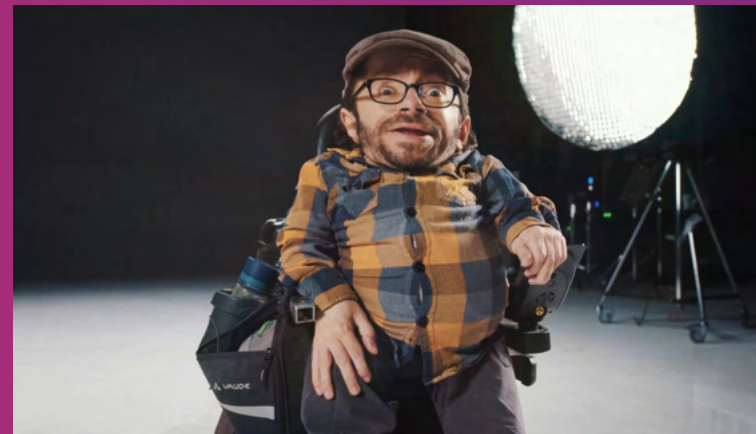
Multi-Channel-Kampagne "Corporate Digital Responsibility" Client: Bundesministerium für Umwelt und Verbraucherschutz Agency: SUPER an der Spree