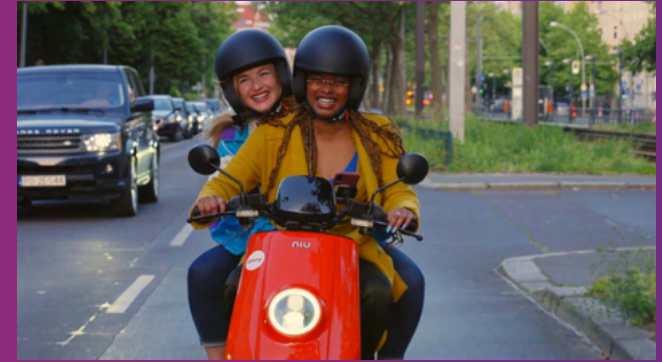
Multi-Channel-Kampagne "E-Sounds of Summer" Client: Emmy